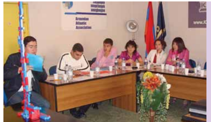
Փոքր ՀԵԿ-երի երիտասարդ մասնագետները կառուցել են «աշտարակ» հաղորդակցվելով և բանակցելով ընդհանուր բարիքի կերտման վարժության արդյունքում: Նոյեմբեր 2010թ.: Երևան:

Վեց երիտասարդ գործիչներ 2010թ. նոյեմբերի վերջին Երևանում մասնակցեցին Հանուն խաղաղության եվրոպական հասարակական կազմակերպությունների գործակցության շրջա-