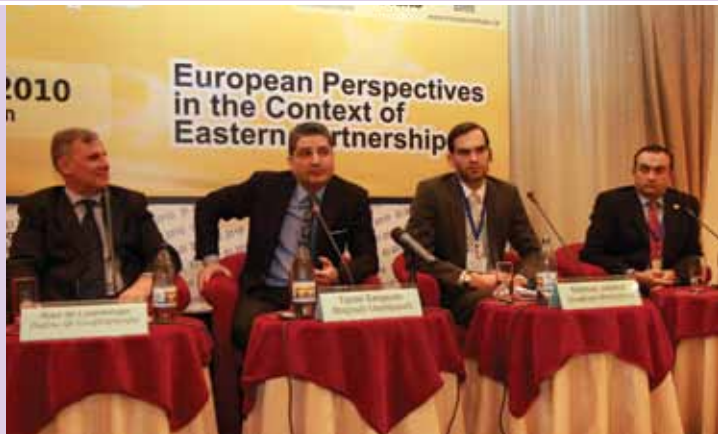
Եվրոպական ինտեգրման ՄՉՄԿ 6-րդ ամենամյա համաժողովի ամփոփիչ նիստը: Նոյեմբեր 2010թ.: Երևան:

2010թ. աշնանը ՄՉՄԿ ներկայացուցիչները մասնակցեցին Բուսինայի և Հերցեգովինայի մայրաքաղաք Սարաևոյում ԵԱՀԿ/ԺՅՄԻԳ-ի կողմից կազմակերպված վերապատրաստման դասընթացներին: Վերջիններս ձեռք բերված գիտելիքներն ու հմտությունները գործի դրեցին ԵԱՀԿ/ԺՅՄԻԳ դիտորդական առաքելությունների կազմում 2010թ. նոյեմբերի 28-ին Մոլդովայի հանրապետությունում կայացած վաղաժամկետ խորհրդարանական և ղեկավարների 13-21-ը Բելոռուսիայում նախագահական ընտրություններին հետևելու ընթացքում: