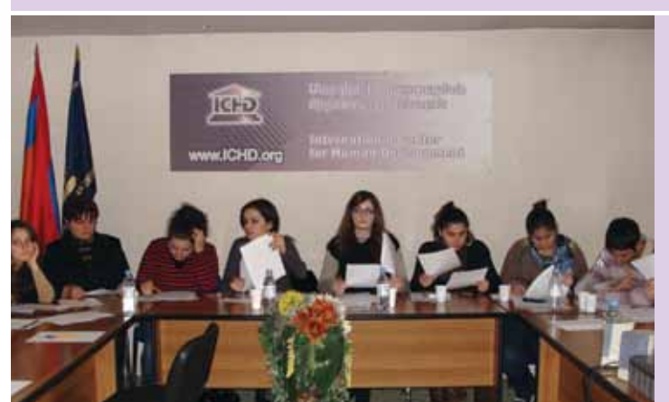
Երիտասարդները քննարկում են ընտանեկան բռնության կանխարգելման գործում ոստիկանության դերը: Նոյեմբեր 2010թ.: Երևան:

ներից: Դասընթացների ընթացքում իրականացվել է ԱՄՆ-ում և Հայաստանում ընտանեկան բռնության առանձին դեպքերի վերլուծություն: Մասնակիցները հնարավորություն են ունեցել համեմատել և համադրել համանման իրավիճակներում ամերիկյան և հայաստանյան ոստիկանների իրավասություններն ու արձագանքելու գործնական կարողություններն ու հնարավորու-