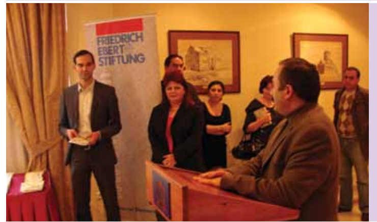
ՄՉՄԿ գործադիր տնօրենի Երախտիքի խոսքը ՖԷՀ ղեկավարությանը երիտասարդ վերլուծաբանների կարծիք բարձրաձայնելուն աջակցության համար: Նոյեմբեր 2010թ.: Երևան:

ՄՉՄԿ-ը նոյեմբերի վերջին ներկայացրեց իր նոր հրատարակությունը՝ «Արևելք-Արևմուտք խաչմերուկ» հոդվածաշարը, որն ամփոփում է Եվրաֆորում Արևելք-Արևմուտք ցանցի երկրների՝ Հայաստանի, Բելառուսի, Գերմանիայի, Ֆրանսիայի, Լեհաստանի և Իսպանիայի, Չեխիայի և Շվեդիայի երիտասարդների մտքերն ու գաղափարները և անդրադառնում է հակամարտությունների կառավարման, մարդու իրավունքների, եվրոպական ինտեգրման և եվրոպական արժեքների տարածման խնդիրներին: Ժողովածուն հրատարակվել է Հայաստանում Ֆրիդրիխ Էբերտ հիմնադրամի ներկայացուցչության օժանդակությամբ: