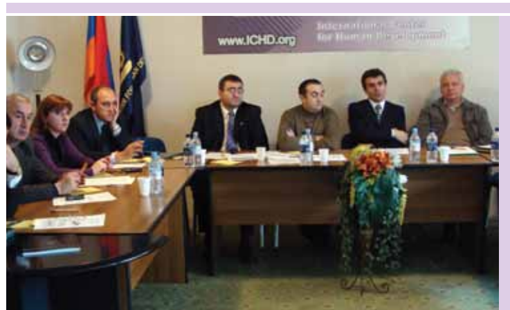
Պետական և հասարակական կառույցների փորձագետները ՄՉՄԿ-ում քննարկում են հակակոռուպցիոն գործունեության մասին հաշվետվության նախագիծը: Նոյեմբեր 2010թ.: Երևան:

ՄՉՄԿ-ն իսպանական «Ֆրիդե» վերլուծական կենտրոնի, ուկրաինական և մոլդովական Հանրային քաղաքականության ինստիտուտների հետ Սևծովյան համագործակցության ծրագրի շրջանակներում իրականացրել է «Պայքար կոռուպցիայի դեմ Արևելյան գործընկերության անդամ երկրներում. քաղաքացիական հասարակության տեսակետը» հետազոտությունը: Գործընկերները յուրաքանչյուր երկրում անցկացրել են հարցազրույցներ քաղաքացիական հասարակության ինստիտուտների, ազգային առաջատար ձեռնարկությունների, ինչպես նաև պետական մարմինների ու զարգացման գործընկերների ներկայացուցիչների հետ: Առանձին հետազոտությունների արդյունքներն այնուհետև միավորվել է մեկ միասնական փաստաթղթի մեջ, որը գործընկերները ներկայացրել են հանրությանը մի շարք միջոցառումների ընթացքում: Ծրագրի շրջանակներում ՄՉՄԿ գործադիր տնօրենը հոկտեմբերի վերջին Կիևում մասնակցել է «Քաղաքացիական հասարակության դերը հակակոռուպցիոն բարեփոխումների մշակման և իրականացման գործում. ուկրաինական փորձը» կլոր սեղանին: